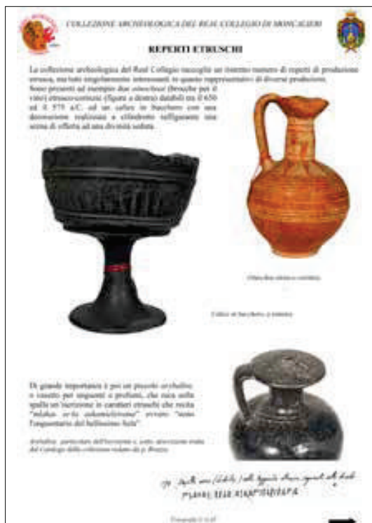
Esempio di scheda

Per ogni reperto è stata redatta su computer una cartella di catalogazione con le fotografie a colori, risalendo alle note originali manoscritte di padre Bruzza, al successivo lavoro di padre Frigerio e alle schede cartacee parzialmente stese dalla Soprintendenza. Lavoro lungo e certosino, ma necessario per dare una collocazione, riconoscere e individuare correttamente i reperti, integrare e riordinare le varie informazioni, pur a volte con difficoltà.