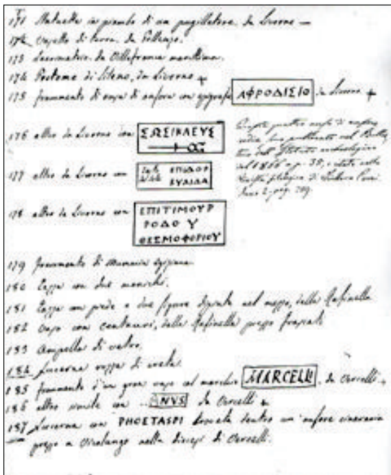
Scheda autografa di Padre Bruzza

Padre Bruzza ha contrassegnato ogni pezzo della collezione con piccole etichette ovali numerate, tuttora visibili e, per ogni pezzo, ha lasciato una sintetica descrizione manoscritta, corredata dai dati in suo possesso in merito alla provenienza, alla datazione ecc. Non di rado le sue annotazioni riempiono il vuoto lasciato dalla disinvolta asportazione dei reperti dal contesto di giacitura originaria.