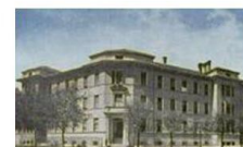
EDUCATORIO DELLA PROVVIDENZA

Corso Trento 13 – 10129 TORINO Tel. 011/ 568149