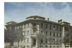
EDUCATORIO DELLA PROVVIDENZA

Corso Trento 13 – 10129 TORINO Tel. 011/ 5681490 - 595292