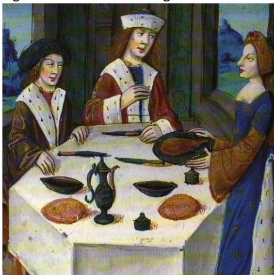
(dalle ricette di maitre Chicard)

Figuranti in costume accoglieranno e daranno vita ad una suggestiva atmosfera medioevale.