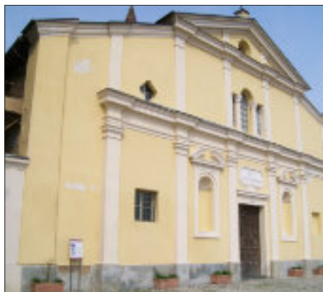
Chiesa di Santa Maria Maggiore, facciata attuale

Tornando in corso Laghi, si riprende il nostro percorso lungo la Strada Antica di Francia. All'altezza della Coop si svolta a sinistra in via don Balbiano (senso vietato in questa direzione per le auto); si supera un incrocio e all'altezza del cimitero di Avigliana si svolta a destra dove la via riprende il nome di Strada Antica di Francia, indicata anche come Via Francigena; a destra della via è visibile un pilone affrescato .