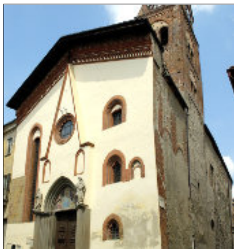
Chiesa di San Giovanni, Avigliana

Poco oltre si arriva alla Chiesa di Santa Maria Maggiore , la più antica di Avigliana.