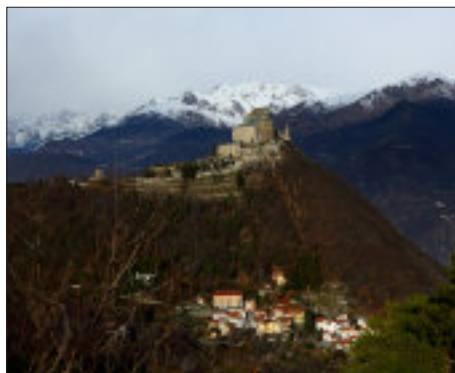
Sacra di San Michele e borgata San Pietro

Dalla Sacra di San Michele, si scende, con un dislivello di circa 300 m, percorrendo il sentiero che parte dal Sepolcro dei Monaci, verso il borgo di San Pietro. Scendendo dalla Sacra per l'antica mulattiera, nei punti più panoramici a strapiombo sulla valle di Susa si possono ammirare le quindici grandi croci in pietra delle stazioni della Via Crucis poste in loco dalla religiosità popolare alla fine del XIX secolo. Lungo il percorso si incontrano due fontane per il ristoro del pellegrino e si trova anche un pilone votivo dedicato all'arcangelo Michele.