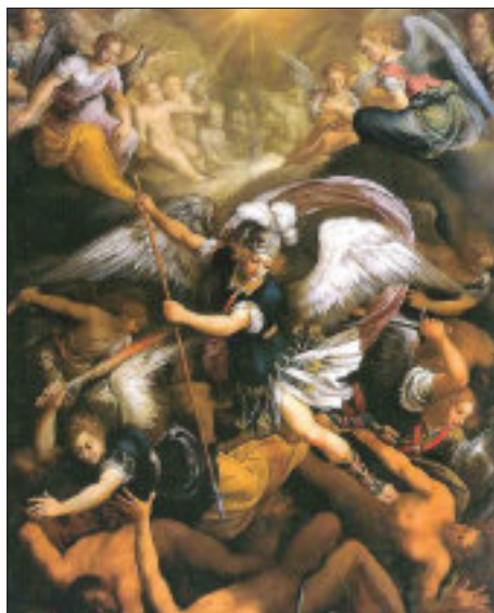
L'Arcangelo Michele, Madonna dei laghi, Antonio Maria Viani

Usciti dalla chiesa abbaziale, il percorso di ritorno passa sotto la torre legata alla leggenda della Bell'Alda . Scendendo dalla scalinata poi, si incontra una grande e particolare scultura dell'Arcangelo Michele e dalla rampa, si percorre la strada pedonale, lasciando a destra una serie di bassi fabbricati che costituivano la foresteria per i pellegrini (ora non più in funzione) per arrivare al Sepolcro dei Monaci .