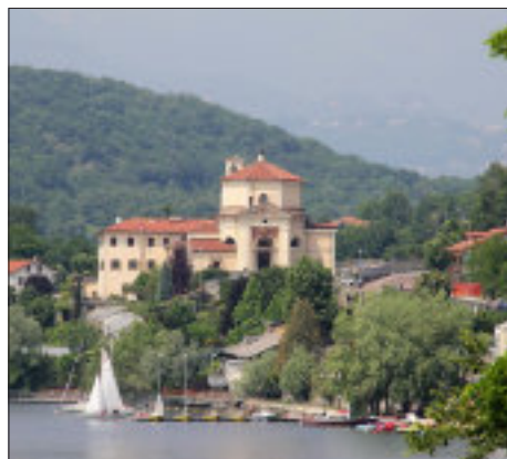
Santuario della Madonna dei Laghi, Avigliana

Terminata la Strada dei Principi, senza uscire dalla frazione Mortera, un sentiero, dopo aver superato una fontana, conduce in pochi minuti alla piazzetta antistante il portale dell' ex Convento di S. Francesco , con la chiesa conventuale consacrata nel 1521, ancora officiata, che conserva affreschi del XVI secolo. Qui (via Sacra S. Michele, 51) un B&B "Certosa 1515" è situato nell'ex Convento. Lasciata la borgata Mortera (Percorso: 4,4 km circa 1 h 30'), si scende lungo la strada asfaltata proveniente dalla Sacra, che dopo alcuni chilometri confluisce nell'itinerario che arriva da Giaveno. Si attraversa quindi il Parco Naturale dei Laghi di Avigliana , composto dal Grande Lago e dal Piccolo Lago. Alla rotonda immediatamente successiva si svolta a sinistra in corso Laghi verso Avigliana. Si incontrano un centro nautico ed alcuni centri velici attrezzati anche con piccole spiagge libere. Più avanti, a lato della strada, sulla sinistra, si arriva al Santuario della Madonna dei Laghi .