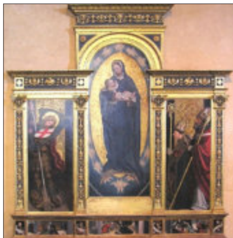
Trittico di Defendente Ferrari alla Sacra di San Michele

Usciti dalla chiesa abbaziale, il percorso di ritorno passa sotto la torre legata alla leggenda della Bell'Alda . Scendendo dalla scalinata poi, si incontra una grande e particolare scultura dell'Arcangelo Michele e dalla rampa, si percorre la strada pedonale, lasciando a destra una serie di bassi fabbricati che costituivano la foresteria per i pellegrini (ora non più in funzione) per arrivare al Sepolcro dei Monaci .