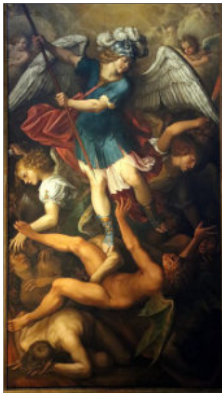
L'Arcangelo San Michele sconfigge il Diavolo, Sacra di San Michele