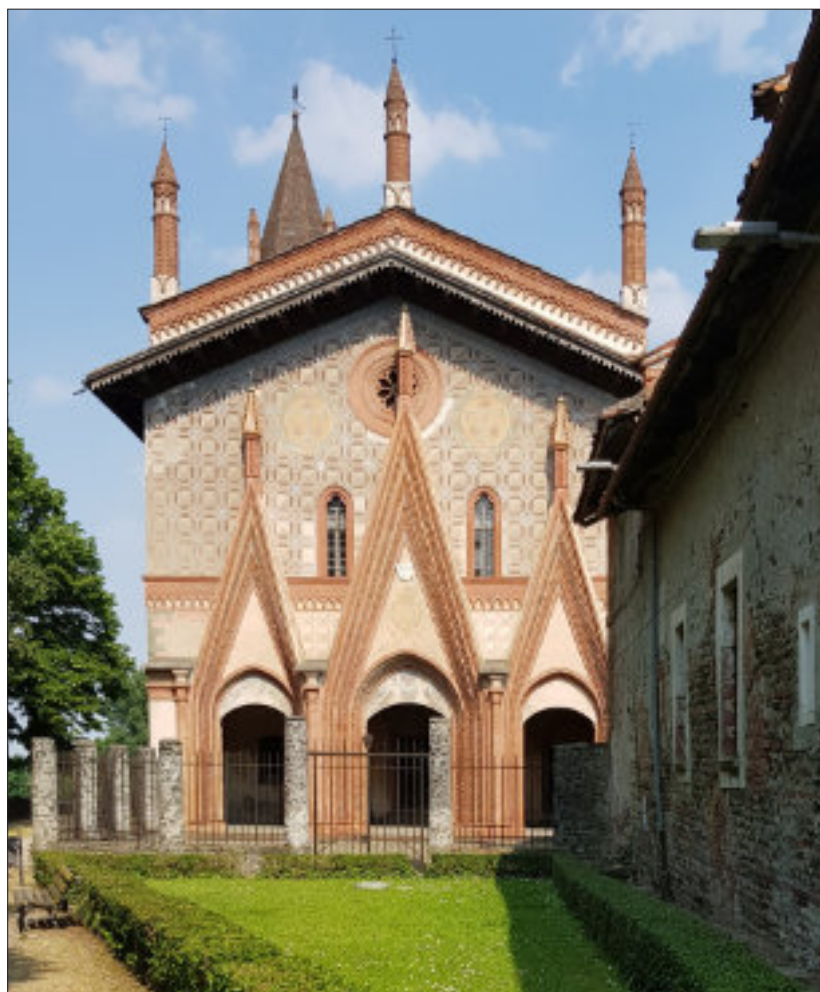
Sant'Antonio di Ranverso

Per ulteriori approfondimenti e annotazioni si veda il percorso più dettagliato sul sito del progetto www.afompresente.it .