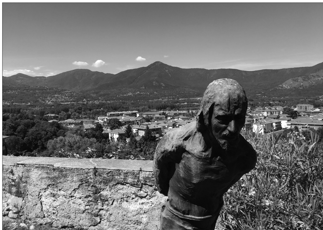
Panorama dal giardino

Io non mi ricordo, ma mi raccontavano che un tempo, al Giovedì Santo, la processione percorreva le vie intorno alla parrocchia, con i figuranti in costume per rappresentare le scene della Passione.