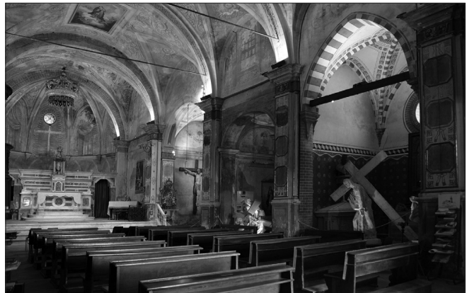
La Chiesa di Santa Maria