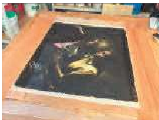
4-5-6. Durante la foderatura