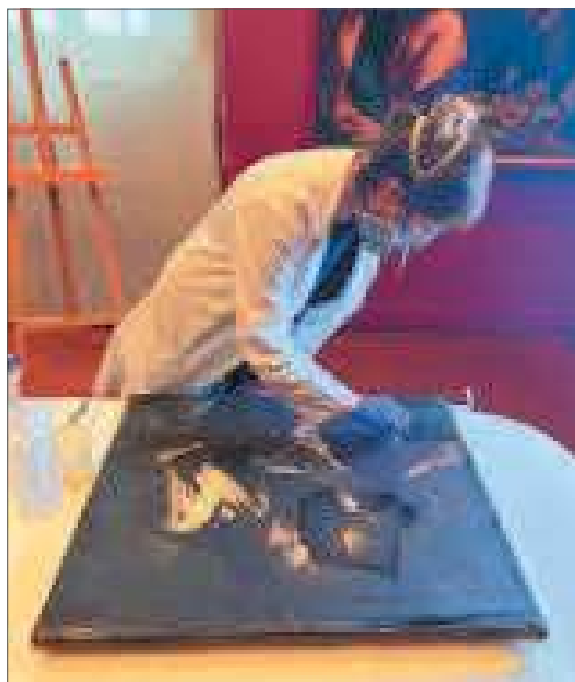
3. Durante la pulitura

dell'Accademia di Belle Arti di Torino, in quanto parte della donazione Mossi di Morano. Prima dell'attuale restauro, l'opera si trovava nei depositi del museo e versava in condizioni conservative mediocri. Oltre ad avere una superficie parzialmente illeggibile (Fig. 1) a causa della vernice, fortemente imbrunita, il dipinto presentava una superficie irregolare, conseguenza di un precedente intervento di foderatura, plausibilmente vecchio di quasi due secoli. L'antica rintelatura, realizzata con un adesivo tradizionale e una tela naturale, non aveva più una gran tenuta, e la tela originaria tendeva a staccarsi dalla tela da rifodero per larghe porzioni del dipinto.