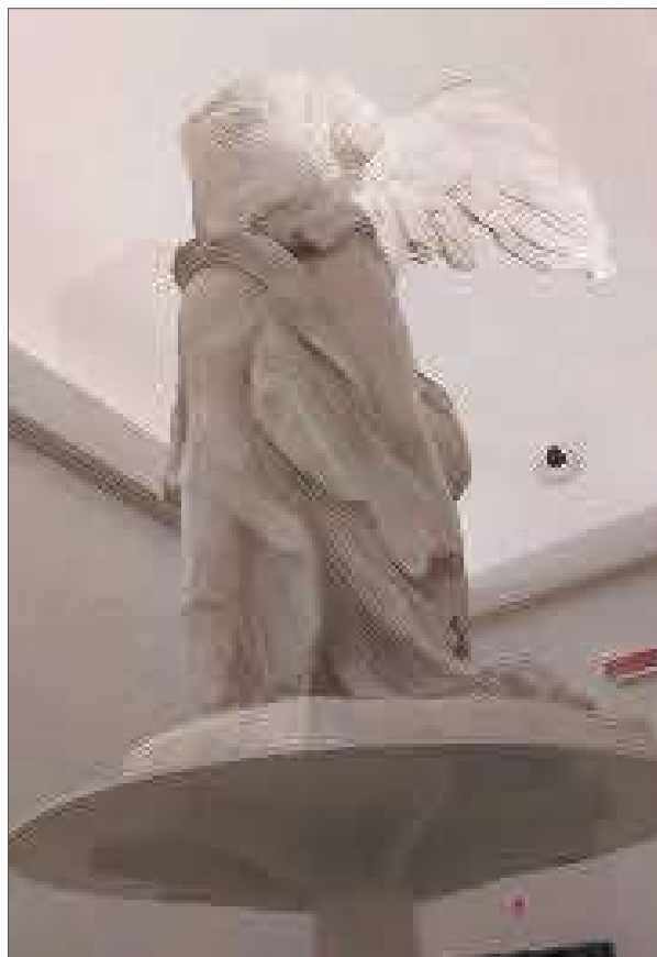
1 a-b. Riallestimento della Nike dopo l'intervento di manutenzione nella rinnovata Galleria di Incisione.