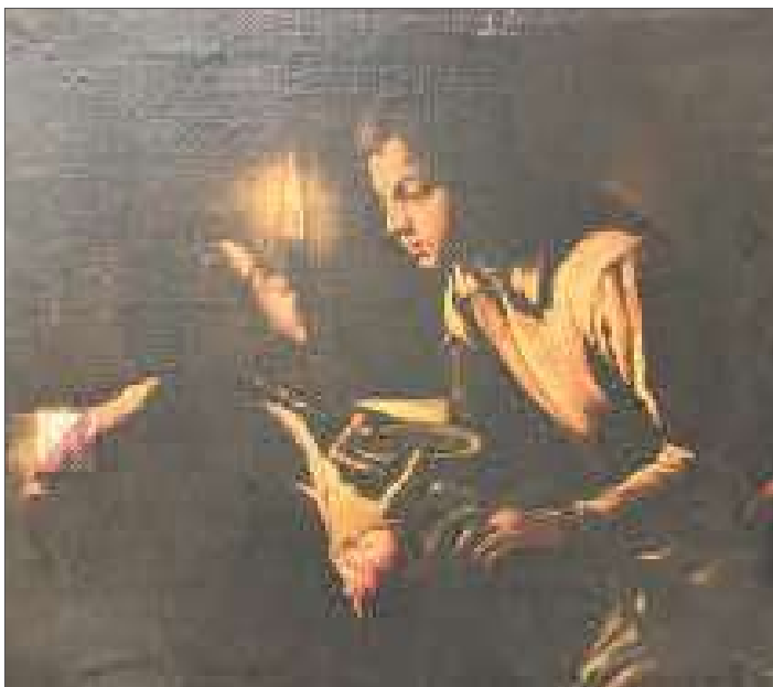
1. Prima del restauro

Esau vende la primogenitura a Giacobbe è un piccolo dipinto attribuito alla bottega di Iacopo Bassano, databile alla seconda metà del Cinquecento, e oggi oggetto di nuovi studi in ambito universitario, oltre che di restauro, dato il suo indiscusso valore artistico. L'intervento di restauro condotto in questi mesi sul dipinto, generosamente