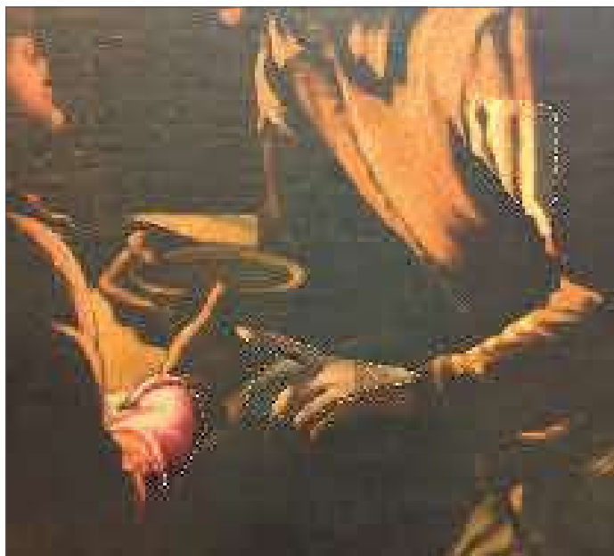
2. Tasselli di pulitura