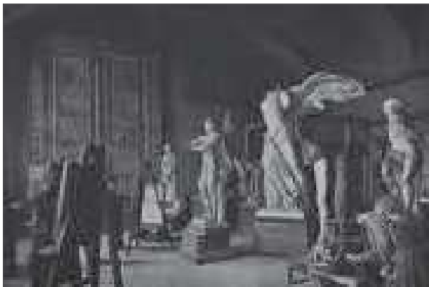
2. La Scuola di Scultura; sala dei calchi così come si presentava già negli anni Venti (foto del 1930, da L. C. Bollea, “La R. Accademia Albertina delle Belle Arti e la R. Casa Savoia”, Torino 1930)