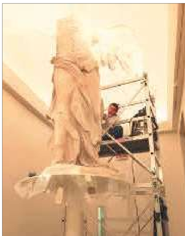
4-5. Veduta d'insieme della Nike durante la fase di pulitura