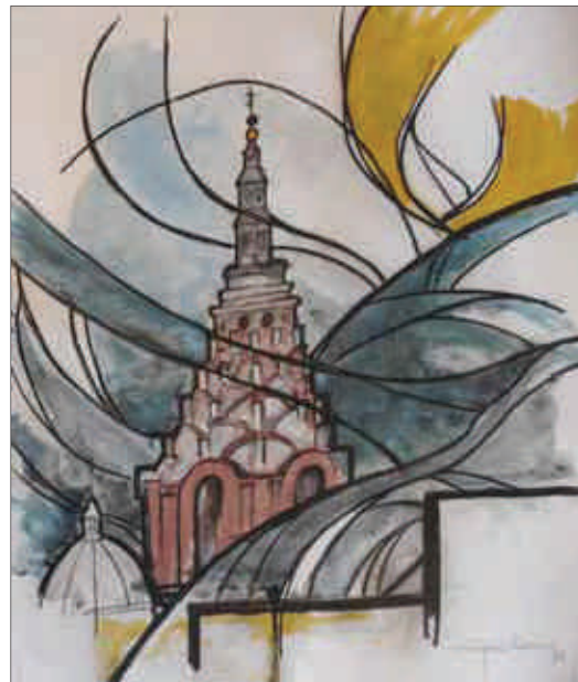
GUIDO DAVICO, La cupola del Guarini, cm. 56x45, acrilico su carta, 2015

L'esito di quest'opera di ricerca e catalogazione ha permesso di indagare parallelismi e differenze tra le varie modalità di rappresentazione sia dal punto di vista storico e artistico sia da quello geografico e sociale. Le moderne tecnologie hanno consentito di utilizzare tecniche agili di consultazione e comunicazione in modo da mostrare a chiunque fosse interessato, e ovunque si trovasse, l'esito delle ricerche e nel contempo permettendo di arricchire facilmente il repertorio, senza costi aggiuntivi di stampa. Il lavoro svolto da UNI.VO.C.A. è stato complementare e indipendente rispetto a quello delle altre ricerche già esistenti, non si è mai sovrapposto, anzi ha permesso, attraverso un "museo virtuale", a molte persone interessate al tema di recarsi nei luoghi citati per scoprire di persona ciò che quei luoghi potevano offrire.